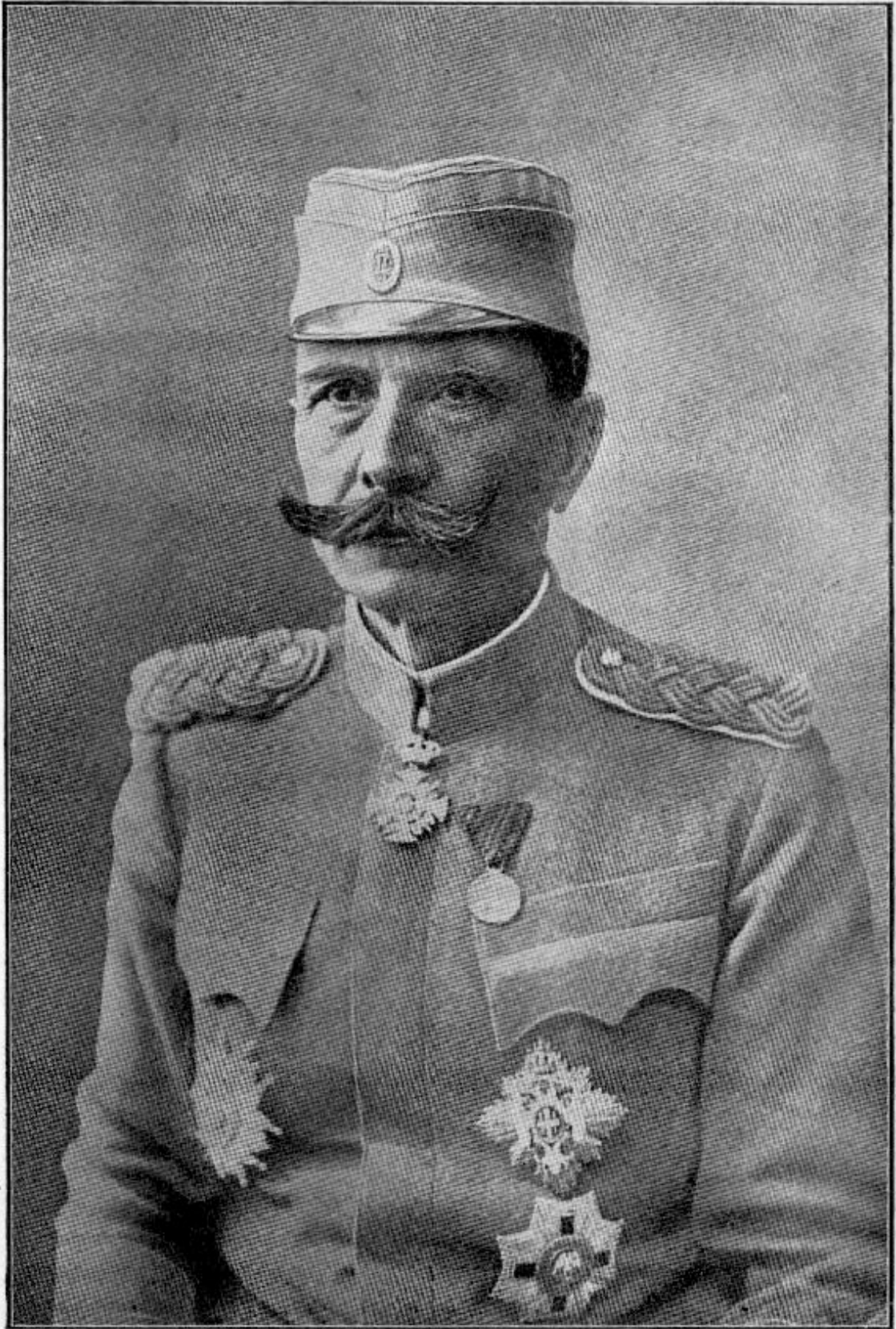
Војвода Петар Бојовић