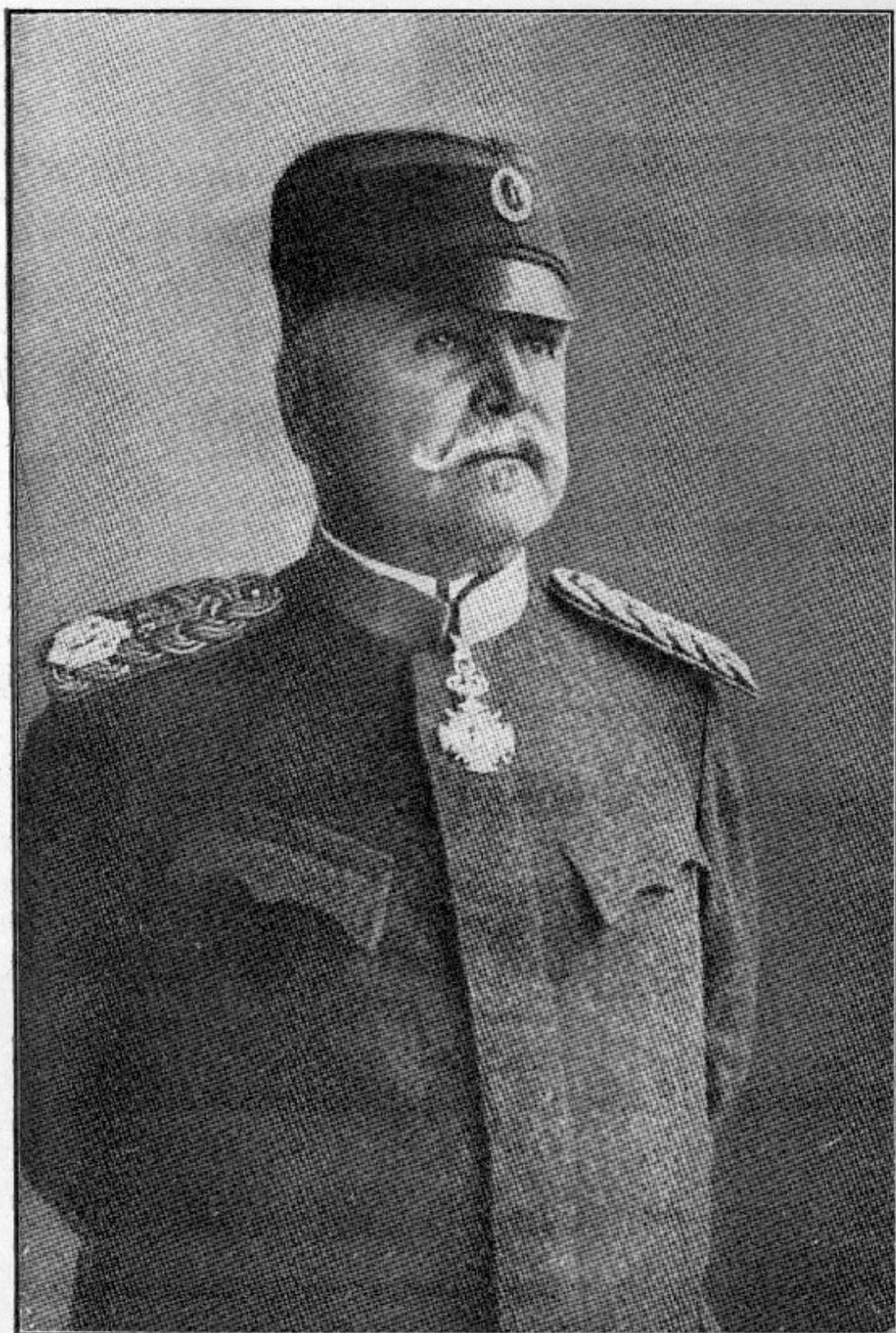
Војвода Степа Степановић